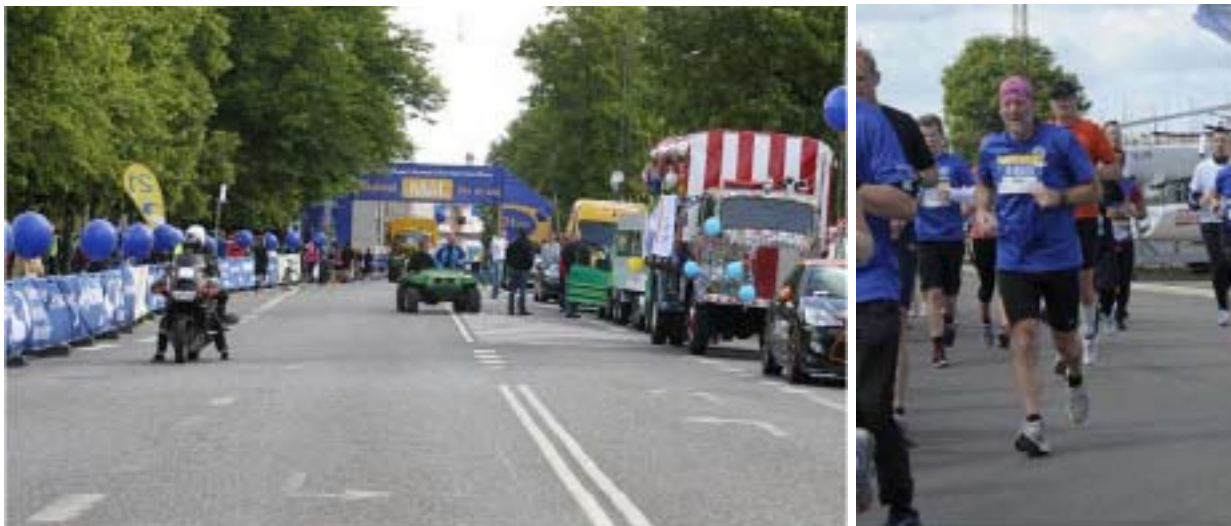
“Hvad de nye ikke kan, det kan den gamle” ved Århus city halvmaraton 2012

SIF Århus løbeudvalg er stiftet og har sin daglige gørem i Århus og omegn, så det var jo nærmest en selvfølge, at ”udvalget” skulle være repræsenteret ved byens første rigtige løb, som blev benævnt Århus City halvmaraton og blev afholdt 3 JUN 2012.