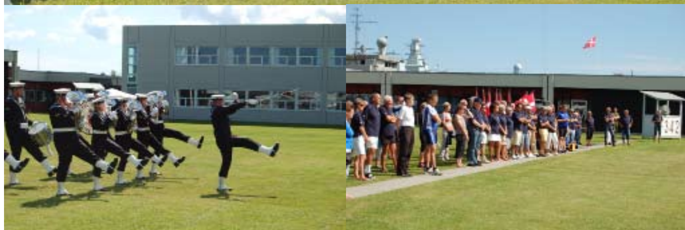
Søværnets Tamburkorps havde mange tilskuere til deres flotte opvisning