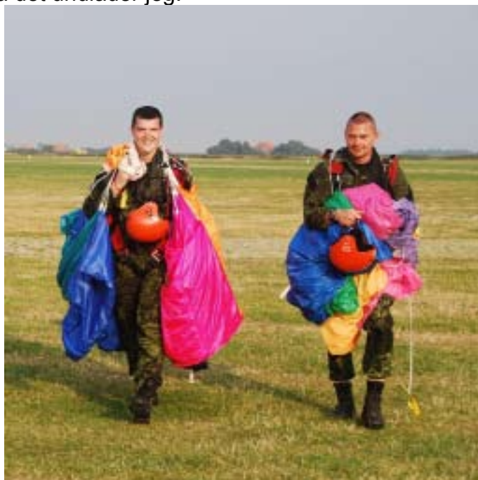
To glade kursister

800 fod, klar til indflyvning. 500 fod, indled til finale, kik efter vindposen. 300 fod, finale, drej op imod vinden og i ca. 3 meters højde bremses ved at trække styrehåndtagene helt ned samtidig. Her er det så en rigtig god ide, at have hørt efter hvad Hans med alvorlig mine havde fortalt hvad man skal gøre. Samle benene, dreje ben og fødder, let bøjede ben og rullefald. Op igen, rundt om skærmen, lave en Daisy (samle styrelinerne) og så samle skærmen op og gå mod hangaren. Nu er det så man som hårdkogt marinesoldat og voksen mand, ikke må nævne den lille dråbe som havde samlet sig i begge tårekanaler ved det succesfulde første faldskærmsudspring. Så det undlader jeg.