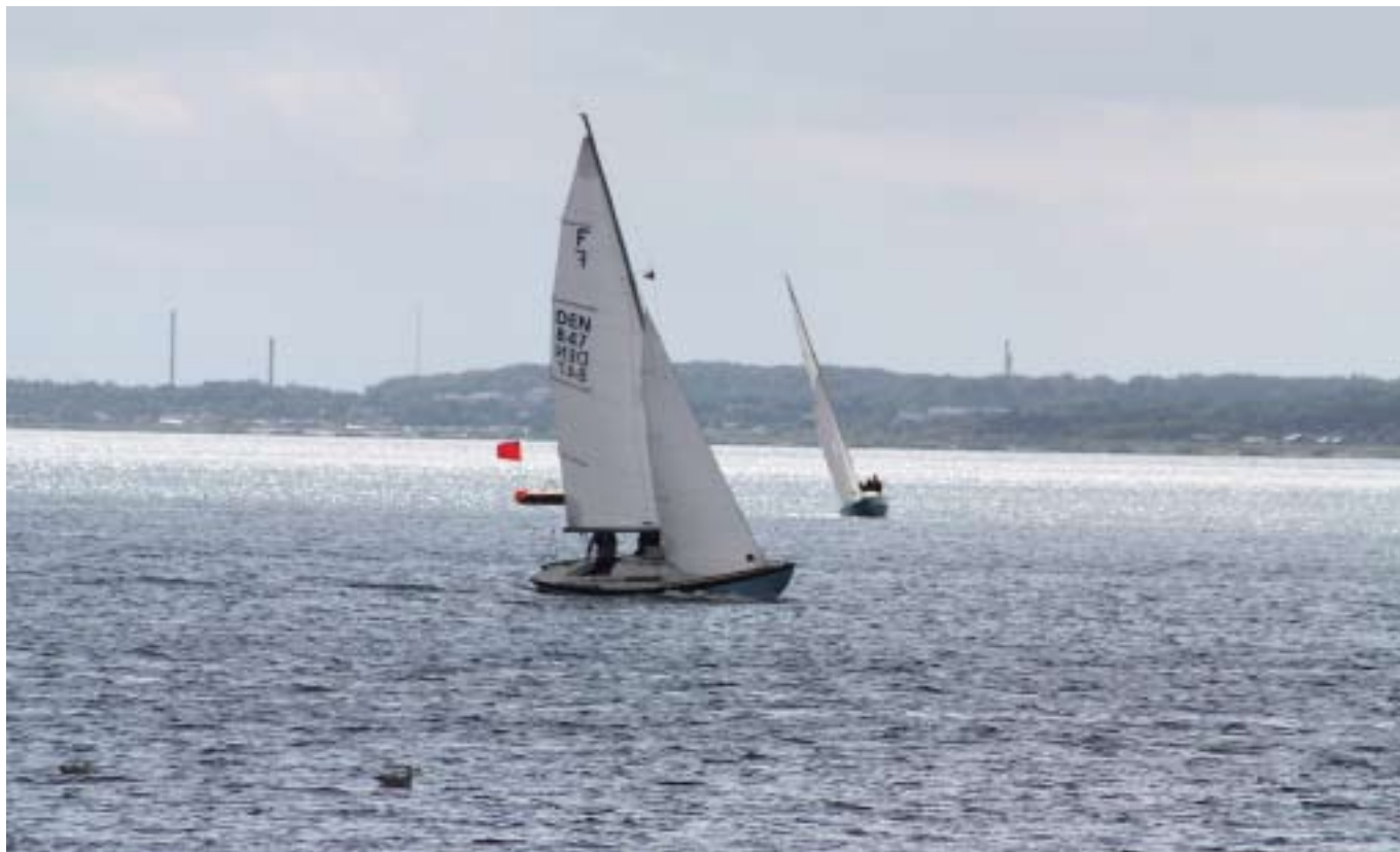
Folkebåde på vandet

SIF medlemmer og ansatte fra OPLOG Frederikshavn og Sergent- og Grundskolen hjalp med de praktiske detaljer.