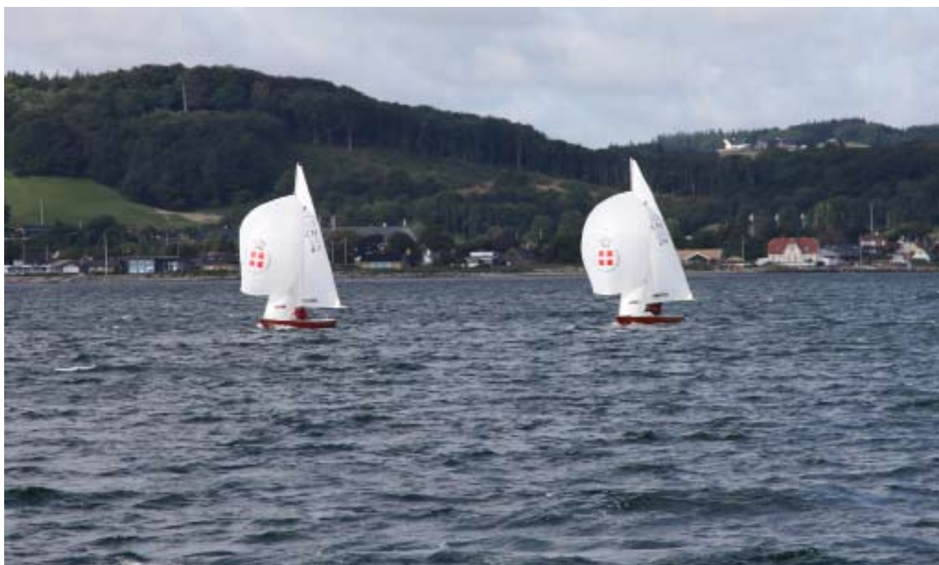
Ynglinge på vandet