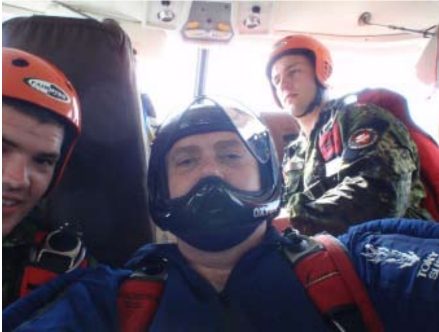
Endeligt på vej.

Kurset er baseret på 4 dage, så det at komme hurtigt i gang med at afvikle spring, betyder utroligt meget. Mange har forgæves taget kursets første dage, endog også været heldige at få et par enkelte spring, for så derefter at møde nogle vejrforhold som gør det umuligt at gennemføre kurset. Dvs. køre 800 km. for 4 dage efter, igen at køre 800 km. retur mod Danmark, uden at stå med et kursusbevis og den eftertragtede vinge i hånden, men kun med et tilgode-bevis på at man kan vende tilbage, når vejret igen er til det. DET ER DÆLME NEDEREN!