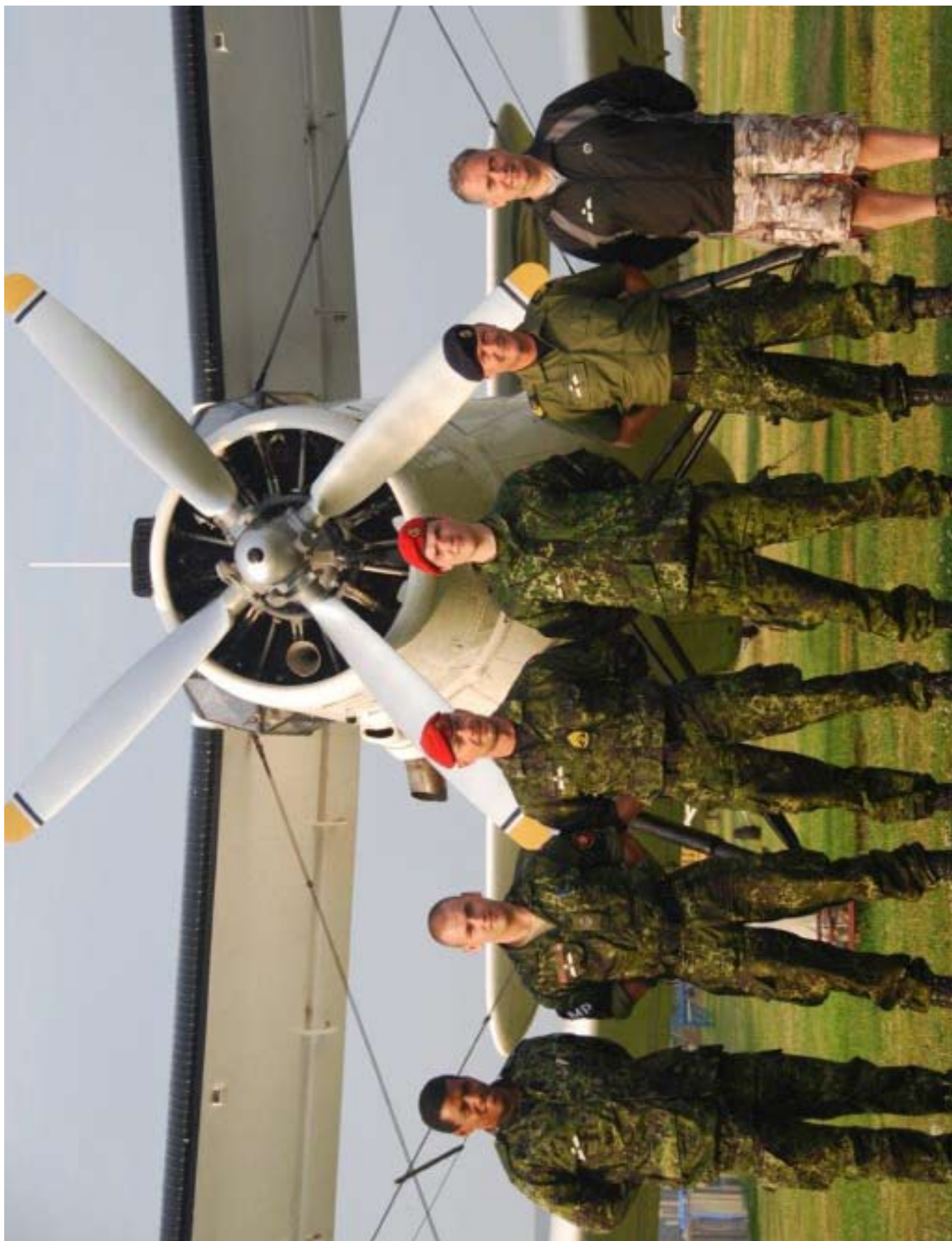
Så er vingerne erobret