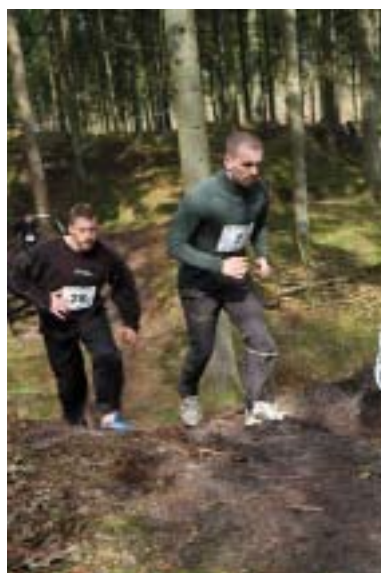
"Sømand I Knibe" ved DMI CROSS-COUNTRY 2012

Jyske Dragonregiments Idrætsforening var d. 11. april 2012 vært for DMI Cross-Country i Vestre plantage med start og mål ved idrætsanlægget på kasernen.